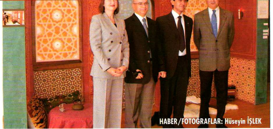
HABER/FOTOĞRAFLAR: Hüseyin İŞLEK

Türkevi'de düzenlenen ikili serginin ilki Javier Romano'ya ait. Sergide sanatçı, tasarımcı ve iç mimar Romano'nun, geleneksel islam sanatının, günümüzün modern iç