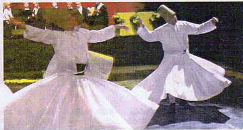
Gecede sahne alan Kültür Bakanlığı Konya Sema ekibi yaptığı gösteriyle özellikle Belçikalı davetlilerden yoğun ilgi gördü.

Mevlana'nın 800'üncü doğum yıldönümünün kutlandığını belirten Alpman, bu düşünürün hoşgörü düşüncesinin bugün bile insanlığa örnek olacak düzeyde olduğunu söyledi. Programda Alman sanatçılar Dieter L. Göbel ve Viktoria Voigt, Mevlana'nın hayatını ve bazı eserlerini Almanca olarak anlatırken, neyzen Ömer Tulgan onlara eşlik etti.